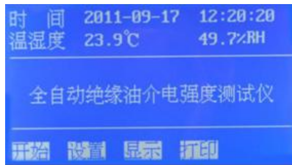
图 1 开机页面