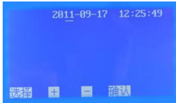
图 5 时间设置子页面

5. 在图 2 页面下，按 选择 键移动光标 ✓ 至时间设置处，按 确认 键即可进入时间设置子页面（图 5）。