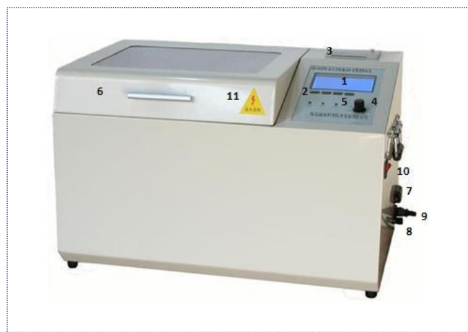
绝缘油介电强度测试仪