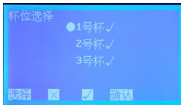
图4 杯位选择子页面

在图3页面下，按选择键移动光标至停升电压，按+或-键设置停升电压，其默认值是80kV，可选范围10kV~80kV(增量 \Delta=10 kV)。选择好停升电压后，按选择键移动光标至杯位选择，按确认键进入杯位选择子页面(图4)。